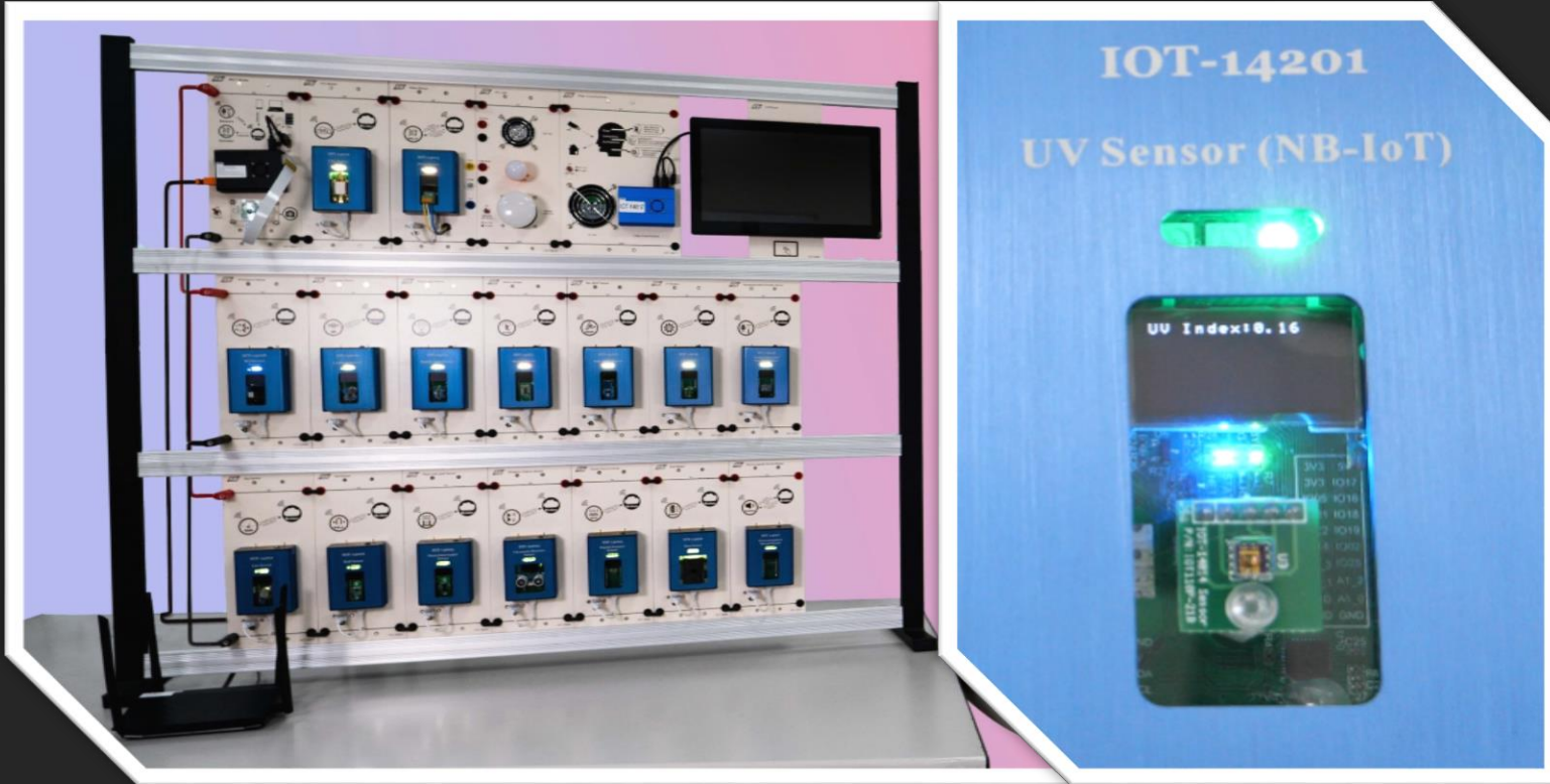
IOT-14201 UV Sensor (NB-IoT)